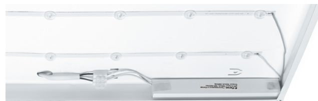
Расположение драйвера вне зоны видимости

AL2117 ТМ FERON – универсальная светодиодная панель с равномерным свечением.