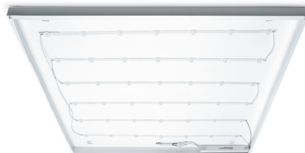
Линзы на светодиодах для равномерного освещения